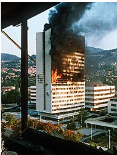
Sitio de Sarajevo. Las guerras yugoslavas están muy presentes en las obras de Pérez-Reverte como Territorio comanche y El pintor de batallas .