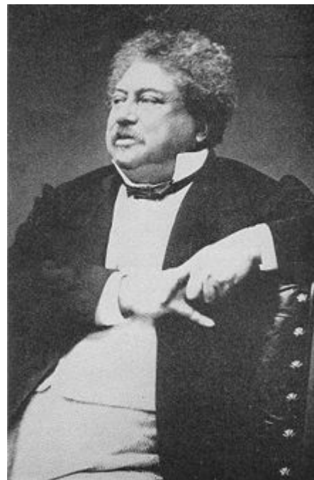
Alexandre Dumas es uno de los autores que más ha influido al escritor.